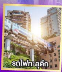
รถไฟฟ้า-ลู่ติก