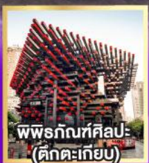
พิพิธภัณฑ์ศิลปะ (ตึกตะเกียบ)