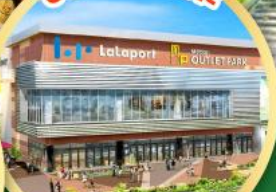
มิคซุย เอท่าเล็ก พาร์ค คาโดมะ