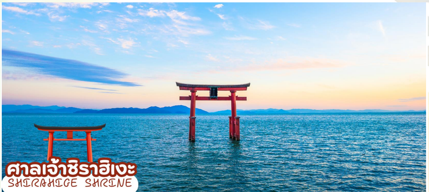
ศาลเจ้าชิราฮิเมะ SHIRAHIME SHRINE

เดินทางสู่ เมืองชิกะ (Shiga) ตั้งอยู่ไม่ไกลจากเกียวโต โดยมีพื้นที่ล้อมรอบทะเลสาบที่ใหญ่ที่สุดของญี่ปุ่น ซึ่งเป็นจังหวัดที่เต็มไปด้วยเทศกาลโบราณ กิจกรรมกลางแจ้งที่สนุกสนาน และปราสาทอันยิ่งใหญ่