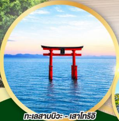
ทะเลสาบบิวะ - เสะโทริอิ