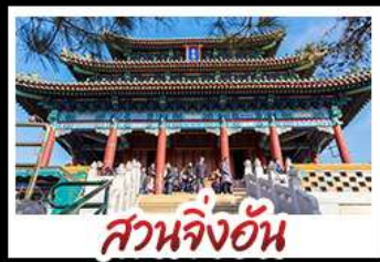
สวนจิ้งอัน