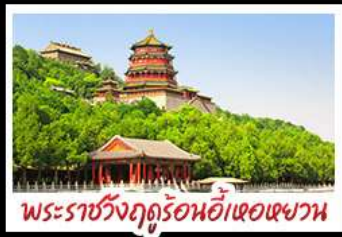
พระราชวังฤดูร้อนอ้าเฮอเฉาหวาน

ท่าแพงเมืองจินค่านจวียงกวน - พระราชวังฤดูร้อนอ้าหอยวน สวนจิ้งอัน - วัดลามะ - ไหม่หลงร้านช้อปปิ้ง - โรงแรม 4 ดาว มือพิเศษ เปิดปีกกั๊ง สุกี้มองโกล MICHELIN GUIDE ร้าน TAO TAO JU