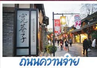
ถนนควานจ้าย