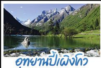
อุทยานปี้เฉิงโกว

ภูเขาสึ่ตงรุณี อุทยานจิวจ้ายโกว นั่งรถไฟความเร็วสูง น้ำพุไม่ไผ่ตักSKP อุทยานปี้เฉิงโกว วัดต้าฉือ ถนนโบราณชอยกวางชอยแคบ ช้อปปิ้งถนนไถ่กู่หลี่ + ถนนซุนซี้ลู่