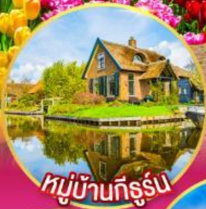
หมู่บ้านที่รูรัน