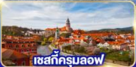
เชสกีครุมลอฟ