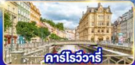
คาร์โรวัวร์