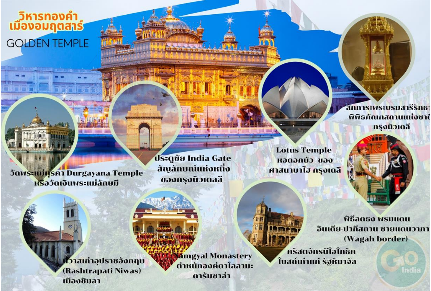
วัดพระแม่ทุสลา Durgayana Temple หรือวัดเงินพระแม่ลักษมี