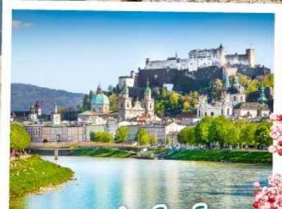
ซาคส์บวร์ค