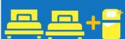
เตียง 3 ก้น ที่นอนเสริม TRIPLE