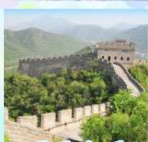
กำแพงเมืองจีน ด้านจวิ๋ยกวน