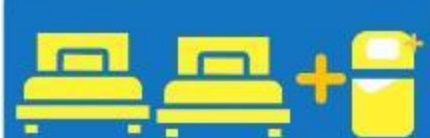
เตียง 3 ก้น ที่นอนเสริม TRIPLE