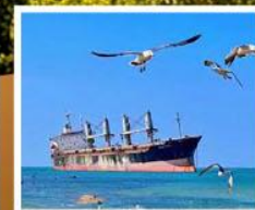
เรือสินค้าก่ายตันบลูวิส