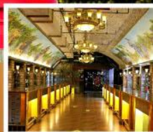
พิพิธภัณฑ์ไวน์ชิงเต่า