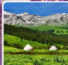
กุ้งห่านาลาติ