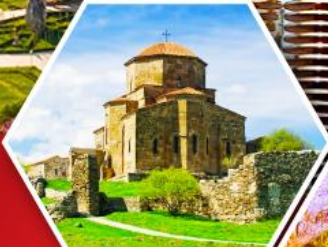
วิหารกออาร์