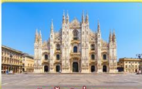
ซอปปิงจุใจที่มิลาน