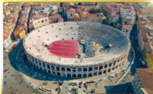
โรงละครโรมันกลางจัหวโรม่า