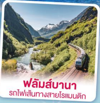
พหลิมส์บานา รถไฟเส้นทางสายโรเมนติก