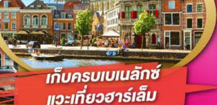
เก็บครบเบเนลักซ์ แวะเที่ยวฮาร์เล็ม