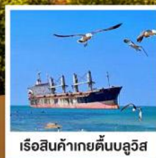
เรือสินค้าเกย์ตันบลูวิส