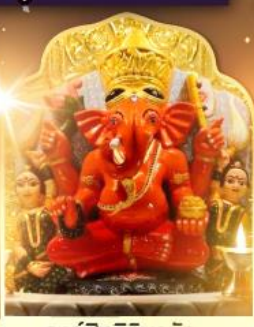
องค์สิทธีวินายก