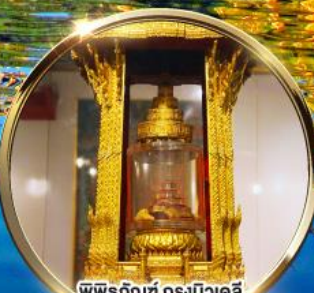
พิพิธภัณฑ์ กรุงนิวเดลี ถราบนมัสการพระบรมสารีริกธาตุ