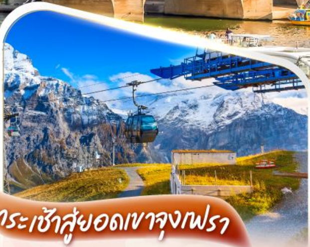
กระเช้าสู่อยอดเขาจุงเฟรา

ล่องเรือแม่น้ำแซนน์ สุดแสนโรแมนติก ☆☆ ชมความงามกรุงปารีส ☆☆