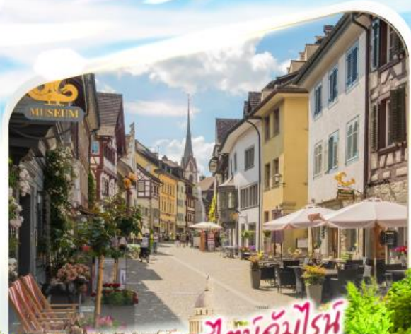
สถานีอัมโมิน