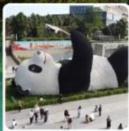
รูปปั้นหมีแพนด้าเซิลฟ์