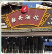
ร้านปังย่างของพ่อหวังเหอตี้