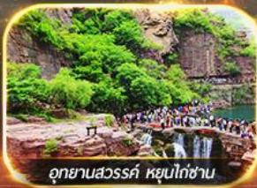
อุทยานสวรรค์ หยุนโก่ซาน