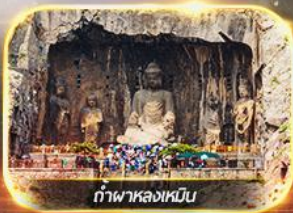
ถ้ำพาลงเหมิน