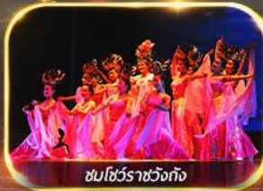
ชมโชว์ราชวงศ์ถัง

นั่งรถไฟความเร็วสูง ย้อนประวัติศาสตร์อันยิ่งใหญ่ "กองทัพทหารจีนซี" สัมผัสความงามอุทยานสวรรค์ พิเศษ!! ชมโชว์ราชวงศ์ถัง เก็บครบทุกไฮไลต์ ซอเป่ิงจู่จาง ห้าง WU YUE