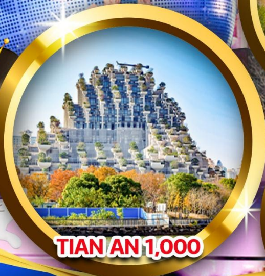
TIAN AN 1,000