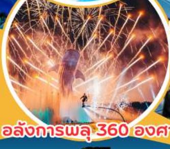
อลังการพลุ 360 องศา