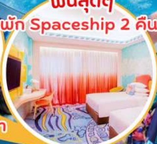
ฟินสุดๆ พัก Spaceship 2 คืน!!