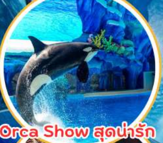
Orca Show สุดน่ารัก