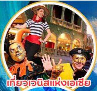
เที่ยวเอเชียแห่งเอเชีย