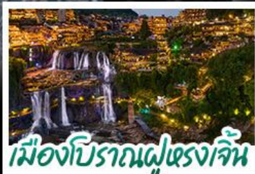
เมืองโบราณฝูตรงเจิน