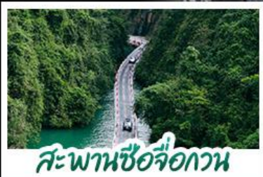
สะพานซื่อจื่อกวน