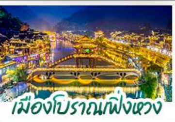
เมืองโบราณฝิ่งเซว่ง

ล่องเรือมังกรชียนซานกังซู่ - เมืองโบราณฝูหลงเจิน สะพานซื่อจื่อกวน - ไร่ชาอู่เจียโต