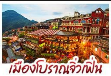
เมืองโบราณจิ่วเฟิ่น

ฟาร์มแกะซิงจิ้ง - ทะเลสาบสุริยันจันทรา จิ่วเฟิ่น - หมู่บ้านประมงหลากสี - ไทเป 101 หมู่บ้านสายรุ้ง - ตลาดล่าเหู & ซีเหมินติง ปลาประธานาธิบดี - เขี้ยวหลงเป่า