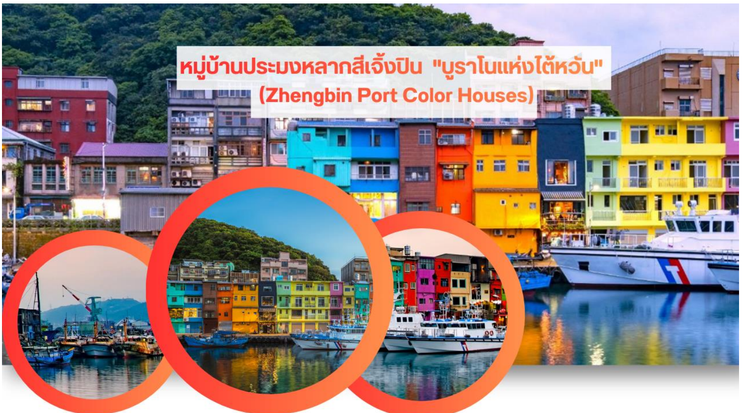
หมู่บ้านประมงหลากสีเจิ้งปิน "บูราโนแห่งไต้หวัน" (Zhengbin Port Color Houses)

เดินทางต่อไปยัง ถนนโบราณจีวเฟิ่น (Jiufen Old Street) โดยนั่งรถประจำทางขึ้นสู่ตัวหมู่บ้าน ที่นี่เป็นพื้นที่สำคัญทางประวัติศาสตร์และการค้าขายเหมือนแร่ในอดีต นักวิชาการชี้ให้เห็นว่าโครงสร้างถนนและบ้านเรือนสะท้อนถึง การวางผังเมืองและสถาปัตยกรรมแบบจีนสมัยก่อน ขณะเดียวกันนักท่องเที่ยวสามารถเพลิดเพลินกับ บรรยากาศโบราณ วิถีภูเขา และร้านค้าของที่ระลึกแบบดั้งเดิม