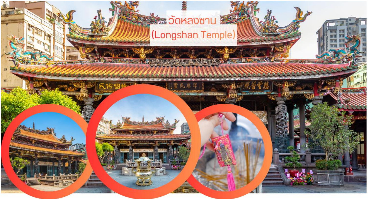
วัดหลงซาบ (Longshan Temple)

กลางวัน รับประทานอาหารกลางวัน Xiao Long Bao (เสี่ยวหลงเปา) (มื้อที่ 8) นำท่านเดินทางสู่แลนด์มาร์คอันสำคัญของไทเปที่มีนักท่องเที่ยวมาเยี่ยมชมอย่างไม่ขาดสาย อนุสรณ์สถานเจียงไคเช็ค Chiang Kai-Shek Memorial Hall (แวะถ่ายรูปด้านนอก) โดยตัวอาคารของอนุสรณ์สถานถูกสร้างขึ้นตามแบบสถาปัตยกรรมจีนโบราณ บันไดทั้งสี่ด้านถูกสร้างด้วยหินอ่อนสีขาวเป็นชั้นตามแบบพีระมิดอียิปต์ หลังคาสีน้ำเงินรวมทั้งยังมีสวนดอกไม้สีแดง ที่เป็นการแสดงออกทางสัญลักษณ์ให้เห็นถึงอิสรภาพ ความเท่าเทียม และความเป็นหนึ่งเดียวกัน ตามสี่ของธงชาติไต้หวัน อนุสรณ์สถานแห่งนี้ถูกสร้างขึ้นเพื่อเป็นที่รำลึกถึงอดีตประธานาธิบดีเจียงไคเช็ค ซึ่งเป็นบุคคลที่มีความสำคัญต่อไต้หวัน ภายในห้องมีการจัดแสดงประวัติและสิ่งของต่างๆเกี่ยวกับท่านนายพลเจียงไคเช็ค ตั้งแต่สมัยที่ยังเป็นลูกศิษย์ ดร. ซุนยัตเซ็น จนก้าวสู่ตำแหน่งผู้นำประเทศ เป็นแหล่งรวมชีวประวัติและรูปภาพประวัติศาสตร์ที่สำคัญที่หาดูได้ยาก ***หมายเหตุ: ตั้งแต่วันที่ 15 กรกฎาคม 2567 เป็นต้นไป กระทรวงวัฒนธรรมไต้หวันได้ประกาศยกเลิกพิธี “เปลี่ยนเวอร์ของทหารรักษาการณ์ ที่บริเวณหน้ารูปปั้นท่านนายพลเจียงไคเช็ค ที่มีขึ้นทุก 1 ชั่วโมง บนชั้น 4 ของอนุสรณ์สถานแห่งนี้ ”