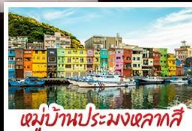
หมู่บ้านประมงหลากสี