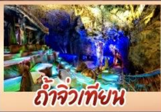
ถ้ำจิวเทียน