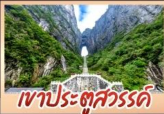
เขาประตูลั่วรด