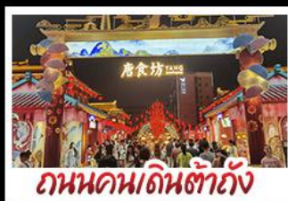
ถนนคนเดินต้าถิง