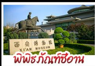
พิพิธภัณฑ์ซีอาน