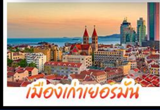
เมืองเก่าเยอรมัน

เมืองเก่าชิงเต่า - สลับกับเมืองโบราณหมิงสุ่ย เมืองเก่าเยอรมัน - ไรไวน์จางยู - สวนสตรอว์เบอร์รี่