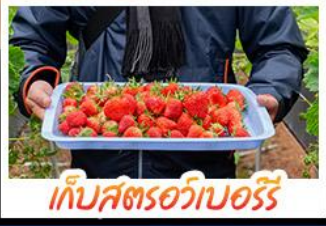
เก็บสตรอว์เบอร์รี่