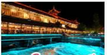
สะพานโบราณหนานเฉียว