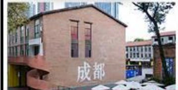
EASTERN SUBURB MEMORY