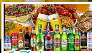
เบียร์ชิงเต่า + อาหารทะเล