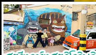
สตรีทอาร์ต สตูดิโอจิบลิ