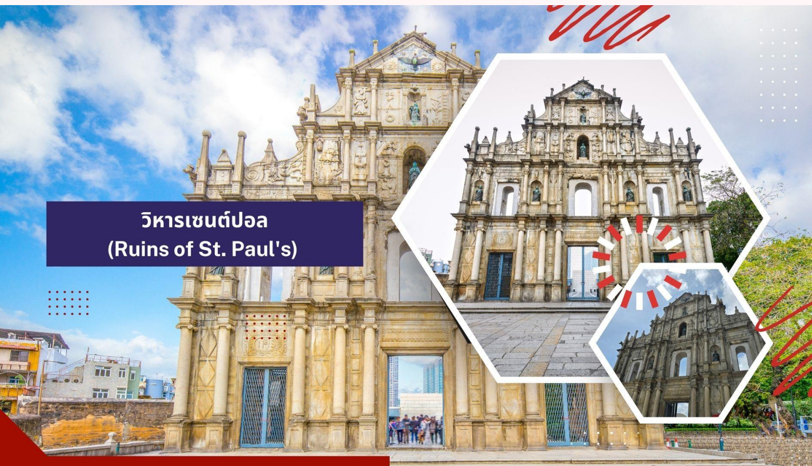
วิหารเซนต์ปอล (Ruins of St. Paul's)

นำท่านเดินทางสู่ นำท่านเดินทางสู่ มาเก๊า (ในการเดินทางข้ามด่าน ท่านจะต้องลากกระเป๋าสัมภาระของตนเอง และผ่านพิธีการตรวจคนเข้าเมืองใช้เวลาในการเดินประมาณ 45-60 นาที) ในอดีตมาเก๊าเป็นเพียงแค่หมู่บ้านเกษตรกรรมและประมงเล็กๆ ซึ่งเป็นเมืองที่มีประวัติศาสตร์ยาวนาน โดยมีชาวจีนกวางตุ้งและฟูเจี้ยนเป็นชนชาติดั้งเดิม จนมาถึงช่วงต้นศตวรรษที่ 16 ชาวโปรตุเกสได้เดินเรือเข้ามายังคาบสมุทรแถบนี้เพื่อติดต่อค้าขายกับชาวจีนและมาสร้างอาณานิคมอยู่ในแถบนี้ ที่สำคัญ คือ ชาวโปรตุเกสได้นำพาเอาความเจริญรุ่งเรืองทางด้านสถาปัตยกรรมและศิลปวัฒนธรรมของชาติตะวันตกเข้ามาอย่างมากมาย ทำให้มาเก๊ากลายเป็นเมืองที่มีการผสมผสานระหว่างวัฒนธรรมตะวันออกและตะวันตกอย่างลงตัว