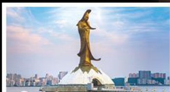
เจ้าแม่กวนอิมริมทะเล