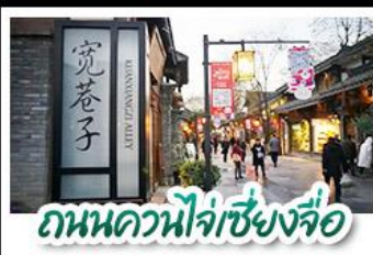
ถนนคาน่าจี่เซียงจื่อ