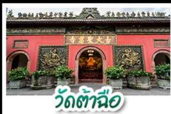
วัดต้าอ้อ