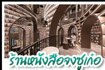
ร้านหนังสือจชชู่เก๋อ

อุทยานสี่ดรุณี - อุทยานป่ฝิ่งโกว - วัดต้าอ้อ หมีแพนด้าบนถนนเซฟี่ - ร้านหนังสือจชชู่เก๋อ ถนนโบราณชอยกวางชอยแคบ ช้อปปิ้งถนนไท่กู่หลี่ + ถนนชุนซี้ตู้ CHENGDU TIMES OUTLETS