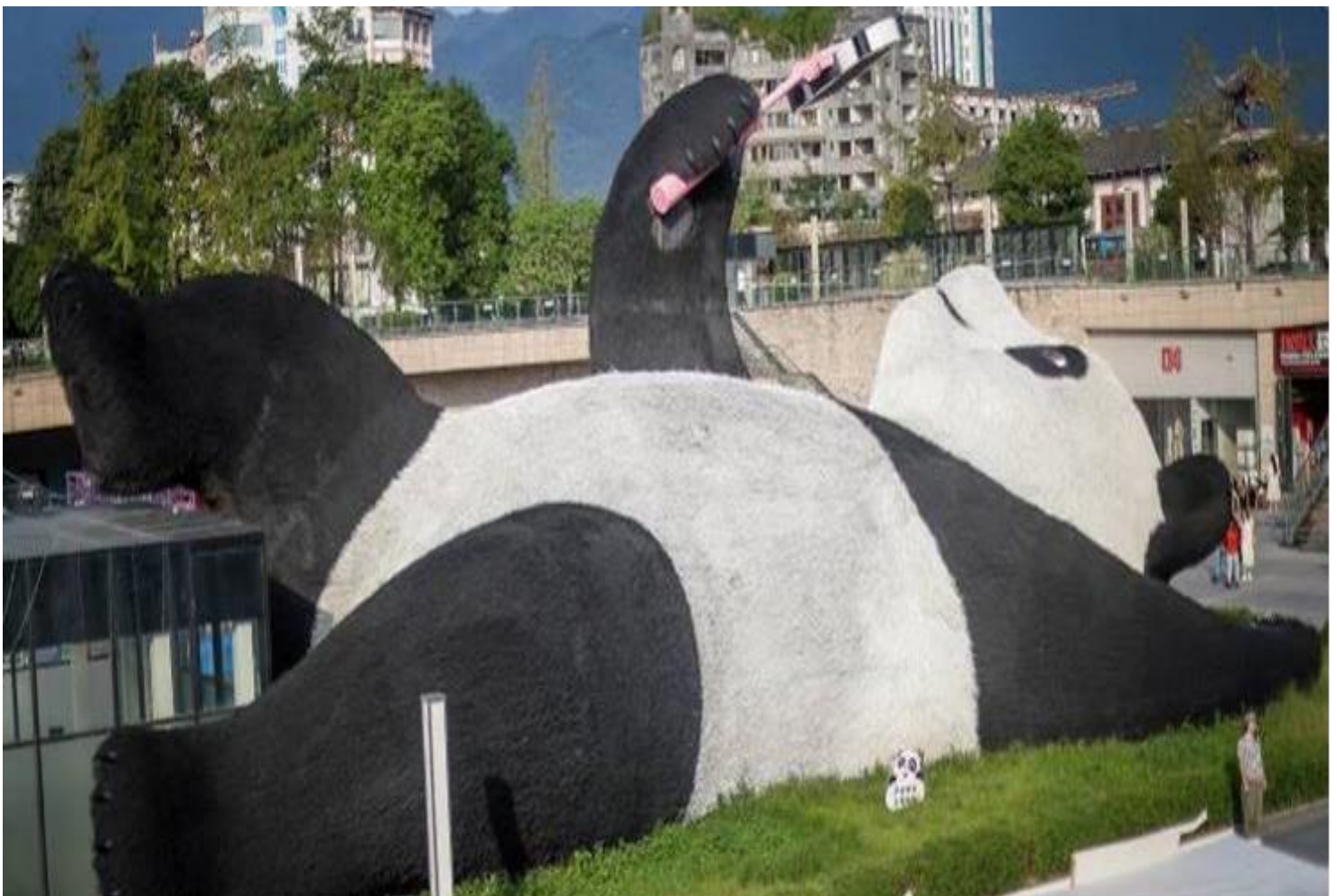
2UTFU-SL001เจิงตู...ดูหมีแพนด้า อุทยานปีศาจโกว อุทยานสัตว์ดุณี Times Outlets Chengdu ร้านหนังสือจงซูเก้อ

นำท่านเดินทางชมความน่ารักของ ศูนย์อนุรักษ์หมีแพนด้า (รวมรถกอล์ฟ) เมืองตูเจียงเยียน ศูนย์แห่งนี้เป็นหนึ่งในสถานที่สำคัญด้านการอนุรักษ์และเพาะพันธุ์หมีแพนด้า ซึ่งเป็นสัตว์สงวนหายากพบเฉพาะใน ประเทศจีนและมีถิ่นกำเนิดในมณฑลเสฉวน แพนด้ามีลูกยากเพราะอุณหภูมิในร่างกายที่พร้อมจะตั้งท้องมีเพียง 3 วันใน 1ปี จะตกลูกครั้งละประมาณ 2 ตัว ตัวที่แข็งแรงเพียงตัวเดียวเท่านั้นจะอยู่รอด อาหารโปรดของหมีแพนด้าคือไผ่ลูกศร ระหว่างการเดินทางชมในศูนย์ฯ จะได้เห็นแพนด้าน่ารักหลายตัว นอนคว่ำบ้าง นั่งอิงบ้าง แพนด้าถูกเรียกว่า “สัตว์ประหลาดพลังงาน” ก็เพราะว่าแพนด้าไม่ชอบออกกำลังกาย ทำอะไรก็ซ้าๆ ทำที่รู้สึกสบายที่สุดก็คือท่านอนและทำนั่ง แม้ปีนขึ้นไปต้นไม้ ก็อยู่นิ่งๆ บนต้นไม้ได้หลายชั่วโมง