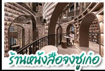
ร้านหนังสือจชชู่

อุทยานสัตว์ดุณี - อุทยานปู้เผิงโกว - วัดต้าอื่อ หมีแพนด้าบนเนินเขา - ร้านหนังสือจชชู่ ถนนโบราณชองกวางฮวยแคบ ช้อปปิ้งถนนไท่กู่หลี่ + ถนนชุนซีลู่ CHENGDU TIMES OUTLETS