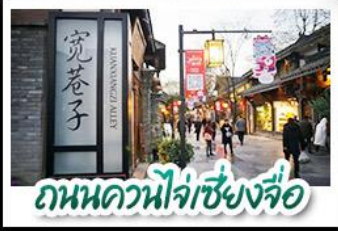
ถนนคาน่าจ๋างเซียงจื่อ