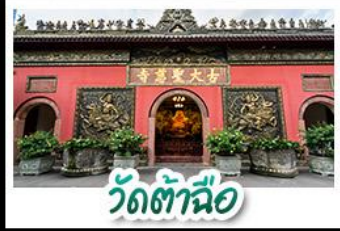
วัดต้าอื่อ