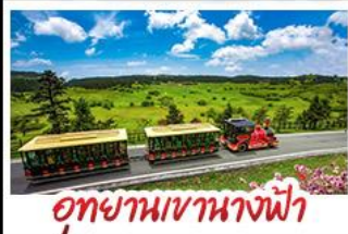
อุทยานเขานางฟ้า