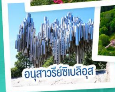
อนุสาวรีย์ซีเบลึส

ฟินแลนด์ - เอสโตเนีย - ลัตเวีย - ลิทัวเนีย แวะเที่ยวเซี่ยงไฮ้