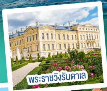
พระราชวังรินดาเล