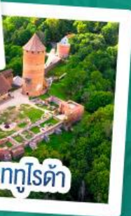
ปราสาทกูไรต้า