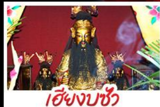
เซียงบูชัว