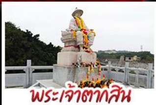
พระเจ้าตากสิน