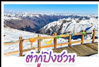
ต้ากู่ปิงชวณ