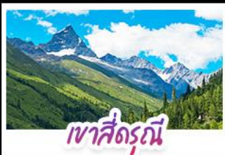
เขาสิตรณี