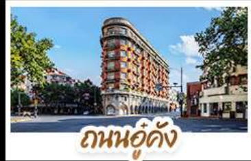
ถนนอู๋ดิง