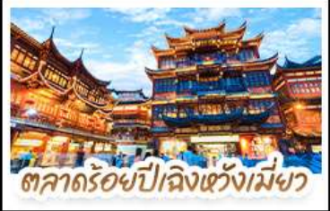
ตลาดร้อยปีเจียงเซี่ยงไฮ้