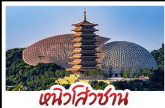
ตึกหิวโห้ซาน

DISNEYLAND SHANGHAI เต็มวัน หิวโห้ซาน - พระใหญ่หลังซานต้าเฟอ NORTH BUND GREENLAND ช้อป ซิม ซิล ถ่ายรูปแลนด์มาร์กมหานครเซี่ยงไฮ้ มือพิเศษ บุฟเฟ่ต์ BBQ, เสี่ยวหลงเปา