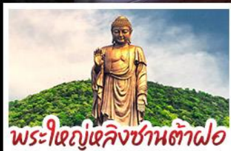
พระใหญ่หลังซานต้าเฟอ