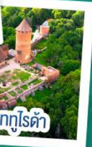
ปราสาทกูโรด้า