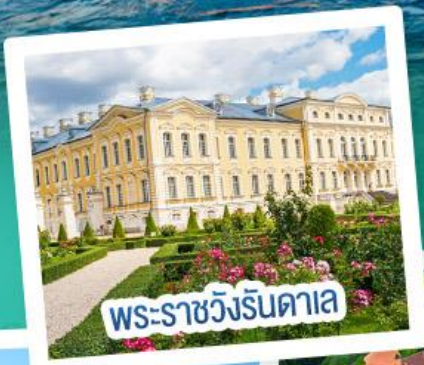
พระราชวังรินดาเล