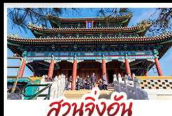
สวนจิ้งอัน