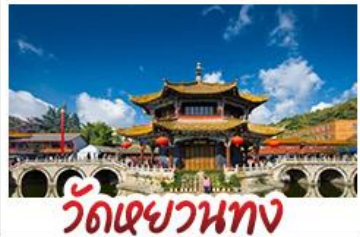
วัดเฉวหนาทง

ถนนสายสีม่วงดอกศรีตรังและลาเวนเดอร์ ภูเขาพระจันทรสีน้ำเงิน - ภูเขาหิมะมังกรหยก เมืองโบราณลี่เจียง - สวนดอกไม้ฮวาหู่บูฉาง รถไฟความเร็วสูง - วัดหยวนทง - รถไฟความเร็วสูง พักโรงแรมระดับ 4 ดาว - KUNMING OLD STREET เมนูพิเศษ สุกี้ปลาแซลมอน สุกี้หัด อาหารว่างตั้ง