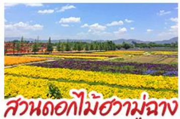
สวนดอกไม้ฮวาหู่บูฉาง