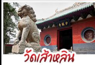
วัดส้าหลิน