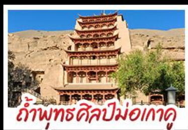
กำแพงพุทธศิลป์ม่อเถาคุ

เป็นทราจครวญ - สระน้ำวังพระจันทร์ ทะเลสาบเกลือฉางท่า - กำพุทธรศิลป์ม่อเถาคุ หุบเขาสายรุ้งจางเย่ - ทะเลสาบซิงไห่